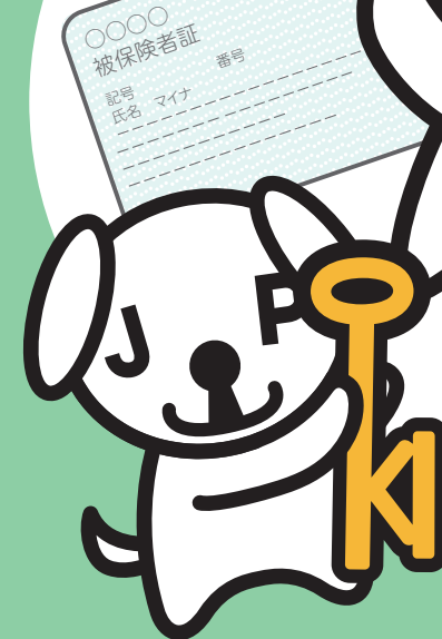
マイナンバー-PRキャラクター マイナちゃん